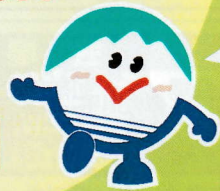
▲大会シンボルマーク