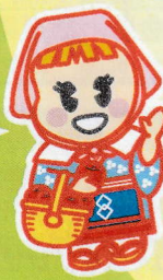
大津軽ロマンキャラクター たか丸くん