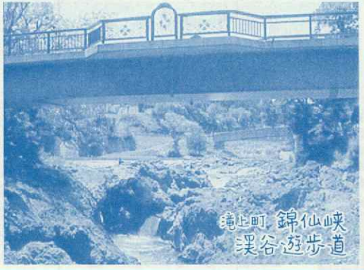
瑠璃町 錦仙峡 溪谷遊歩道