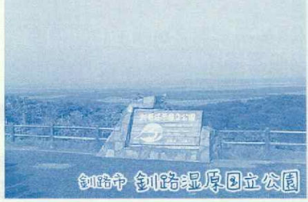
釧路市 釧路湿原国立公園