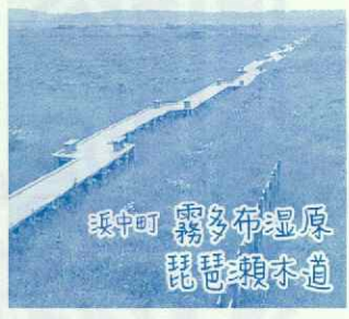
瑛中町 霧多布湿原 琵琶瀬木道